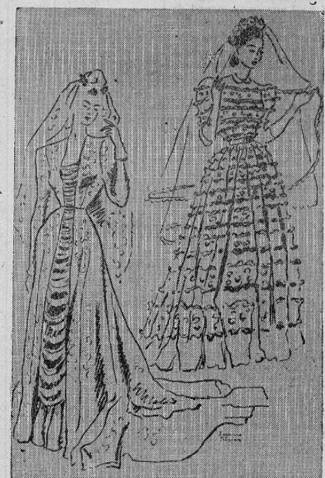
Primer plano: Vestido largo de novia de satén de la Casa Marcel Rochas.—Segundo plano: Vestido de novia de muselina de la Casa Lucien Lelong. (SIF).